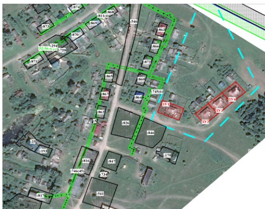
Масштаб 1 : 2 000