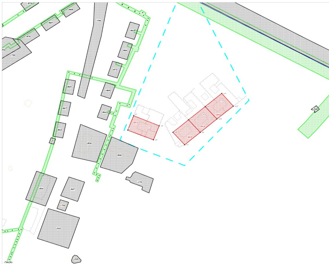
Масштаб 1 : 1 000