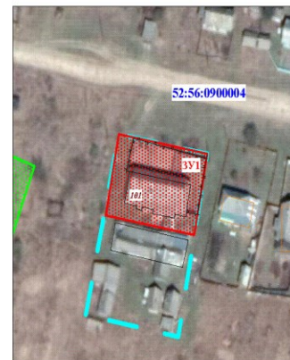
Масштаб 1 : 1 000

Земельные участки образуются в соответствии со следующими материалами и сведениями: