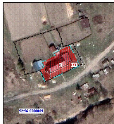
Масштаб 1 : 1 000

Земельные участки образуются в соответствии со следующим материальным сведениями: