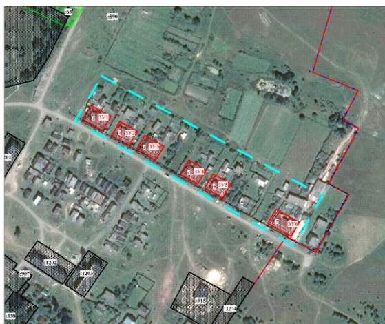
Машина 1 : 2 000