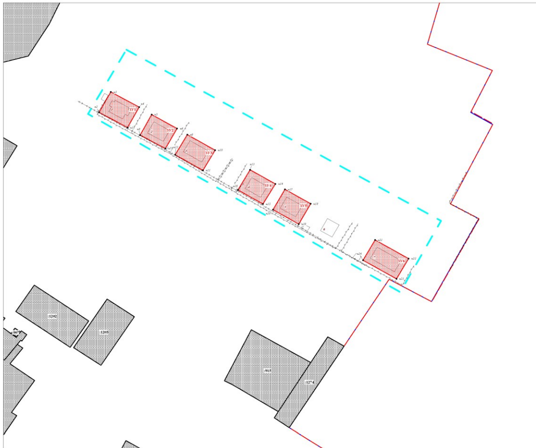
Мащштаб 1 : 1 000