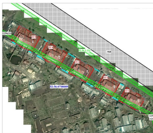
Масштаб 1 : 1 000