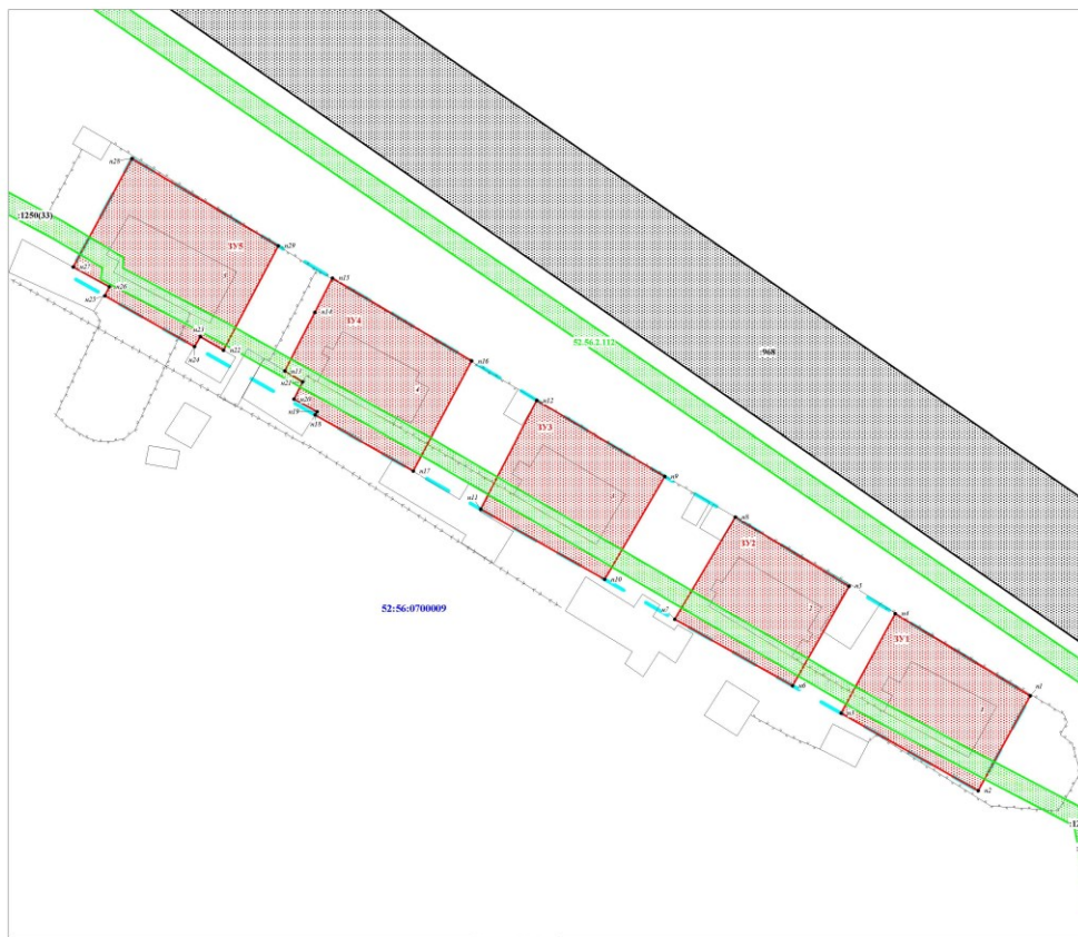
Масштаб 1 : 500