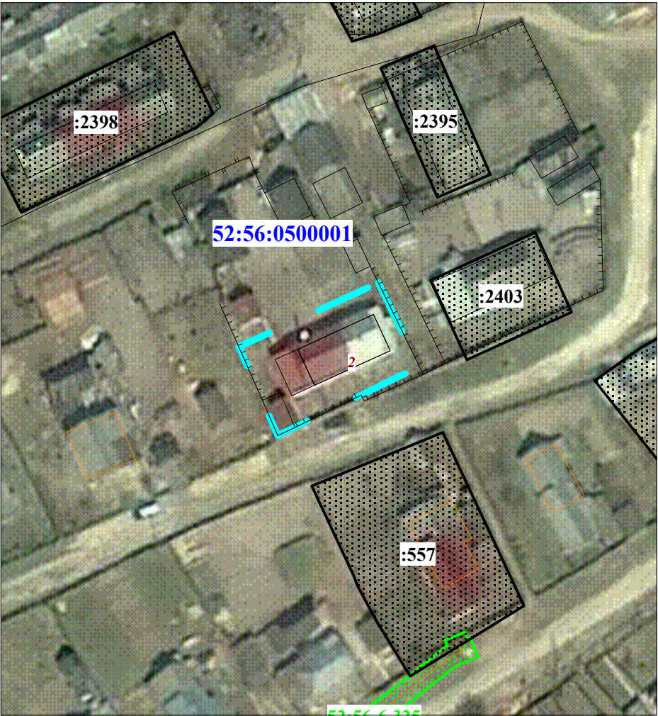
Масштаб 1 : 1 000